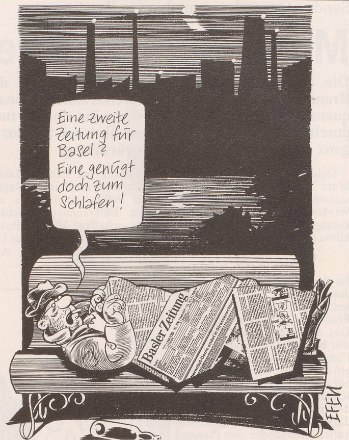
Lanciert das Haus Ringier in Basel eine zweite grosse Tageszeitung? Der Entscheid dazu soll im Lauf des Sommers fallen.