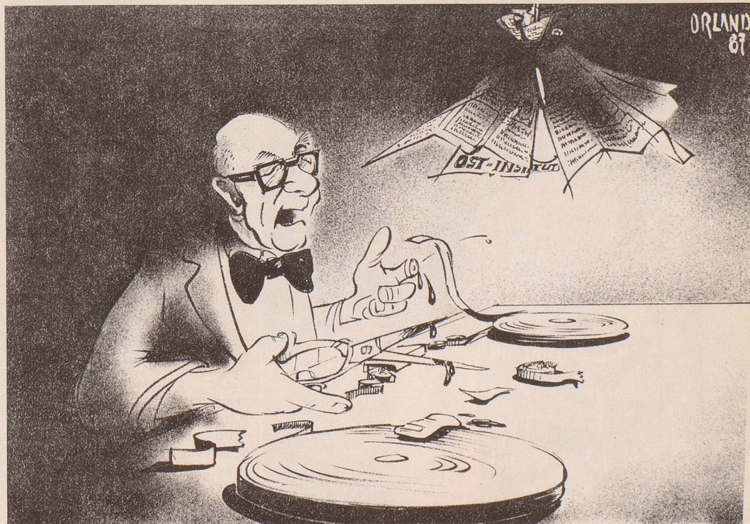
Ins eigene Fleisch geschnitten ... Sagen- oder sagerhafte Medienanalyse?