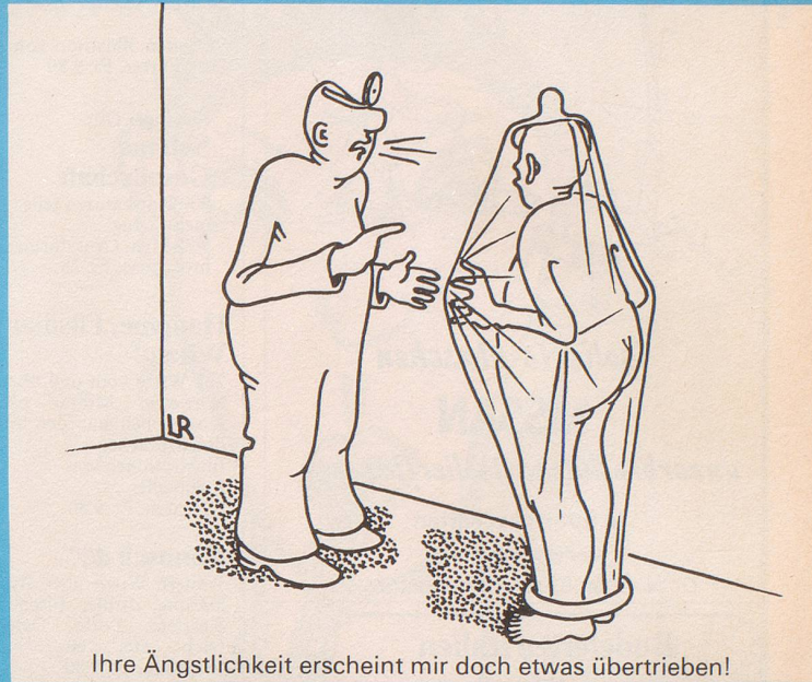
Ihre Ängstlichkeit erscheint mir doch etwas übertrieben!