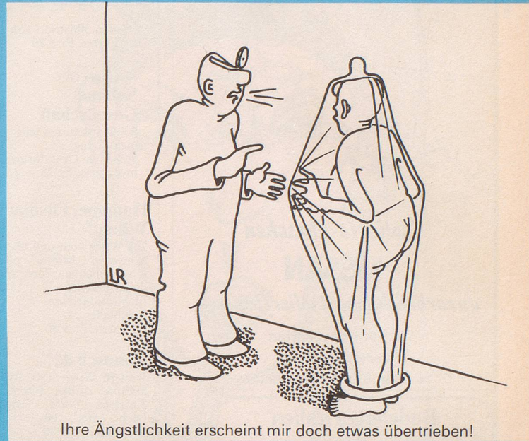
Ihre Ängstlichkeit erscheint mir doch etwas übertrieben!