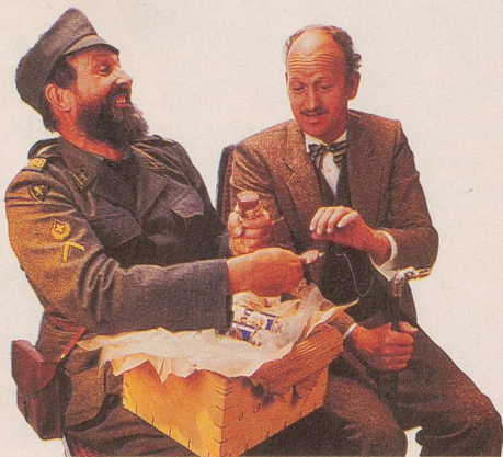
Ein Tag, an dem die Verpflegung gewährleistet ist.