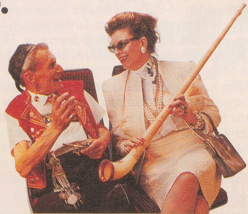
Ein Tag, an dem Swiss Music die ganze Welt begeistert.