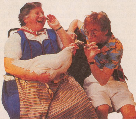
Ein Tag, an dem die ländliche Natur greifbar ist.