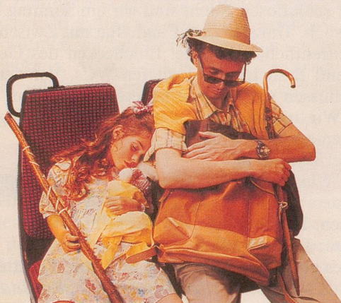
Ein Tag, an dem man wie im Traum nach Hause kommt.

Mit der 7-Tage-Karte können Sie während sieben aufeinanderfolgenden Tagen unbeschränkt Postautofahren.