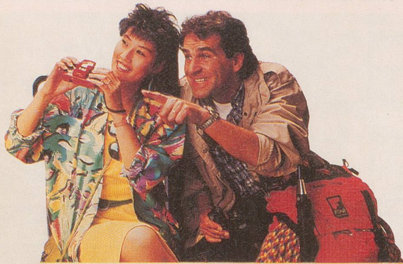
Ein Tag, an dem alle Alpengipfel «Fujijama» heissen.