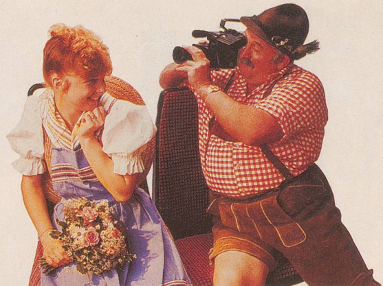
Ein Tag, an dem man plötzlich zum Filmstar wird.