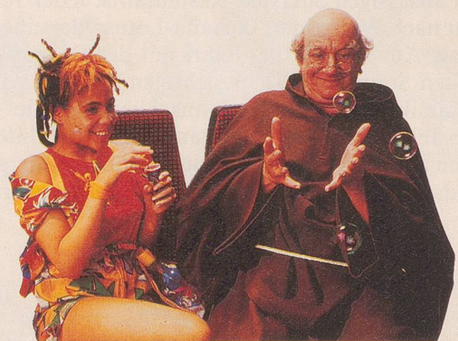
Ein Tag, an dem man sich wieder ganz jung fühlt.