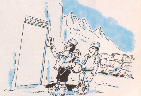
Immer noch warten einige Viertausender darauf, von unerschrockenen, aber gut ausgerüsteten Berggängern gestürmt zu werden.