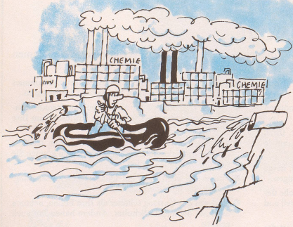
Trotz unserer gezähmten, begradigten und gestauten Flüsse sind gefährliche Wildwasserfahrten auch heute noch möglich.