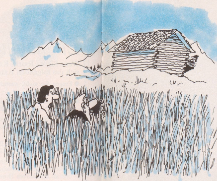
Abenteuerliche Photosafaris auf den Spuren einer fast ausgestorbenen Spezies: «Da haben wir aber wahnsinnig Glück gehabt: ein echter Bündner Bergbauer!»