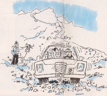
Etwas ganz Besonderes für abenteuerlustige Deutsche: die Schweizer Geröllhalden- und Bergwästen-Rallye zwischen der deutschen und italienischen Grenze ganz ohne Autobahnvignette!