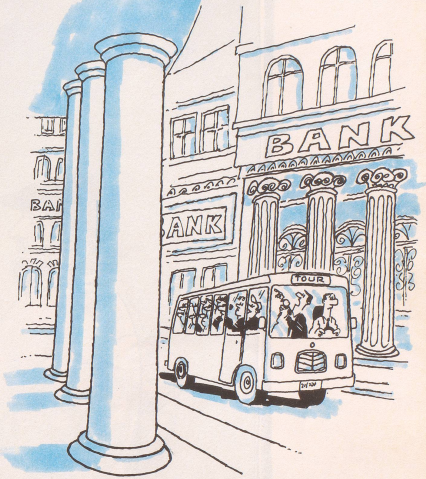
Speziell für Amerikaner: Tour durch den Schweizer Banken-Dschungel: «... und links lagern im Untergeschoss 200 Millionen Franken von Herrn Marcos, rechts, etwa zehn Meter unter Strassenniveau, werden 15 Millionen Franken Contra-Gelder vermutet, sofern sie richtig verbucht sind.»