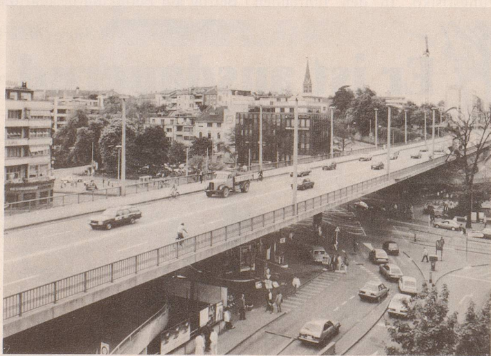
Aus «Basel – gestern und heute aus dem gleichen Blickwinkel»

Hanns U. Christens Texte begleiten den Leser auf dieser Reise in die Vergangenheit mit ihren kulturellen Höhepunkten im 15. und 16. Jahrhundert sowie dem stetigen Niedergang, verursacht durch eine nicht abbreisende Folge von verheerenden Kriegen. Das Buch will dazu mahnen, den Raubbau an der Regio nun nicht durch die wirtschaftliche Entwicklung weiterzutreiben, sondern mit allen möglichen Massnahmen zu unterbinden.