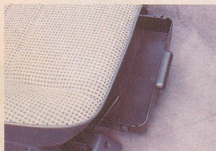
Das praktische Ablagefach unter dem Beifahrersitz.

Das geht auf keine Kuhhaut, was ein Mazda an Vorteilen bietet.