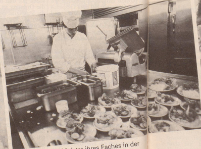
6 ...während Meister ihres Faches in der Bordküche erlesene Gaumenfreuden arrangieren.