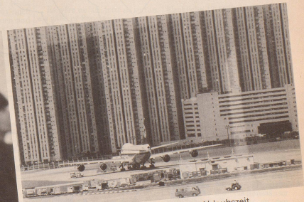
8 Wichtig! Vergeuden Sie keine kostbare Urlaubszeit zwischen Flughafen und Ferienwohnung. Im Bild die vorbildlich gelegene Holiday-Siedlung «Siesta del Sole» in Rimini.