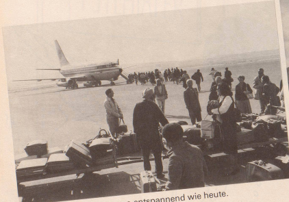
1 Noch nie war Fliegen so entspannend wie heute. Das Vergnügen beginnt bereits am Boden. Im Bild die neue Gepäckabfertigung im Flughafen Kloten.