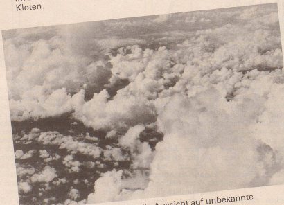
5 Geniessen Sie entspannt die Aussicht auf unbekannte Landschaften,...