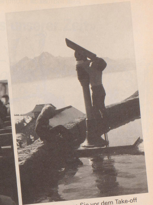
4 Und vergessen Sie vor dem Take-off nicht, Ihre Lieben zuhause über Flugplan und Route zu informieren.