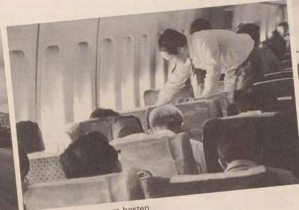
3 ... in der Ihnen am besten zusagenden Position.