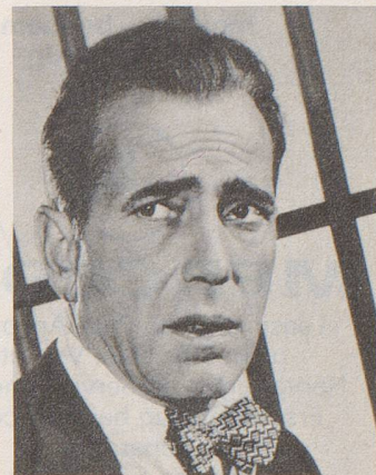
Raymond Chandler: «Alles, was Bogart tun muss, um eine Szene zu beherrschen, ist, dass er auftritt.»

Peter Bogdanovich: «Bogart, der Mensch, und Bogart, der Held, sind heute so sehr miteinander verschmolzen, dass keiner den Unterschied zwischen den beiden nennen könnte, wenn es überhaupt je einen gegeben hat.» Nicht nur im Film ist Bogart oppositionell – Gangster zeichnen sich durch Respektlosigkeit gegenüber Autoritäten aus –, sondern er war's auch im Leben. Er widersetzte sich den gesellschaftlichen Normen Hollywoods, kämpfte für die Gleichberechtigung von Minderheiten, trat 1947 auf dem politischen Parkett als Organisator eines Komitees hervor, das sich gegen McCarthys Hexenjagd auf vermeintliche und echte Linke in der amerikanischen Filmindustrie engagierte. Gerade aus der Identität von Privatperson und Filmfigur ergibt sich vielleicht jene spezielle Magie der mythischen Aura Bogarts, die heute noch fasziniert und einem die vielen schlechten seiner 75 Filmrollen vergessen lässt.