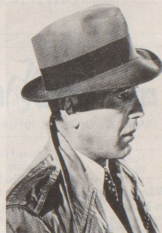
Peter Ustinov: «Humphrey Bogart war eine aussergewöhnliche Person auf einem Gebiet, wo Persönlichkeiten gewöhnlich nicht aussergewöhnlich sind.»