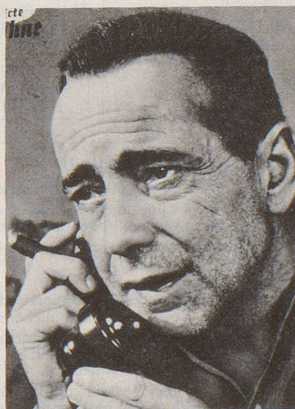
Truman Capote: «Egal ob Bogey bis zum Morgengrauen Poker spielte und einen Brandy zum Frühstück hinuntergoss: Immer war er pünktlich auf der Szene ... mit wörtlich gelernter Rolle (der stets gleichen Rolle, zugegeben, aber es gibt nichts Schwierigeres, als Wiederholungen immer wieder interessant zu machen).»