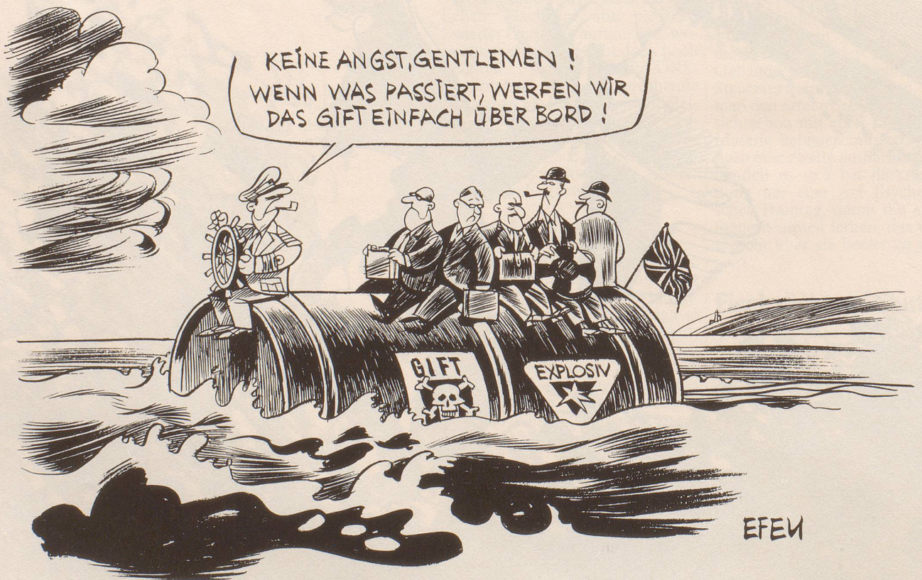
Die Kanalfähren transportieren ungehindert hochgiftige und -explosive Lastwagenladungen.