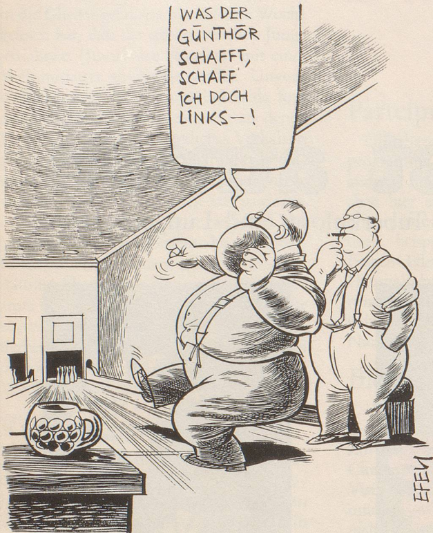
Der Spitzensport scheint erfreuliche Auswirkungen auf den Breitensport zu zeitigen.