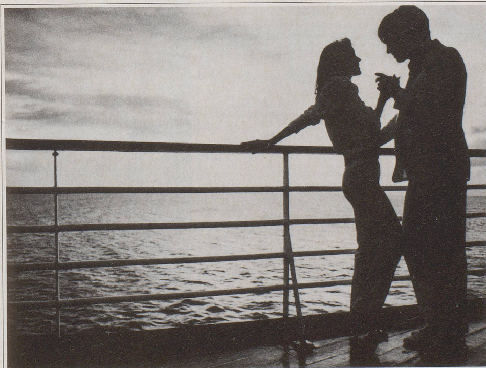
Lintas RCCL 187

Karibik. Abend auf der «Song of America». Nach dem «Captain's Dinner» geniessen wir die frische Brise auf dem Achterdeck. «Gibt's hier eigentlich noch Piraten?» fragt sie. «Keinen ausser mir», sage ich und fletsche die Zähne. Sie lacht und begleitet mich zurück in den Salon, wo gleich die Show beginnt. Möchten Sie nicht einmal die Karibik so erleben? Mit uns, der Kreuzfahrtgesellschaft Nr. 1. Unser Prospekt gibt Ihnen HOLIDAY einen Vorgeschmack.