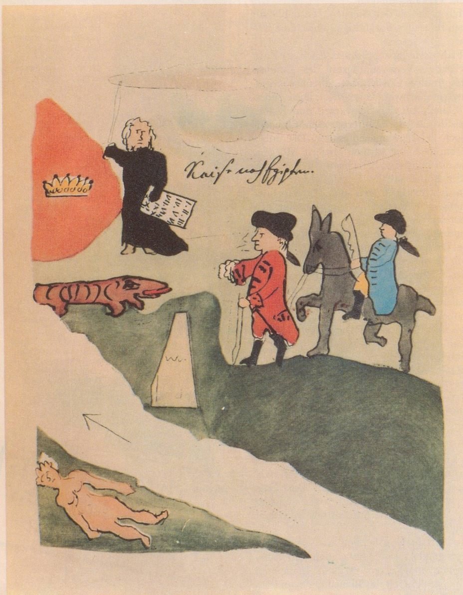
Reise nach Ägypten: Körner sitzt auf einem Esel, der blutige Tränen über seinen Herrn weint. Ein Krokodil taucht aus dem Roten Meer auf, darauf schwimmt die Krone des Pharaos, oben steht Moses mit den Gesetzestafeln und am andern Ufer liegt Kleopatra mit der Schlange am Busen.