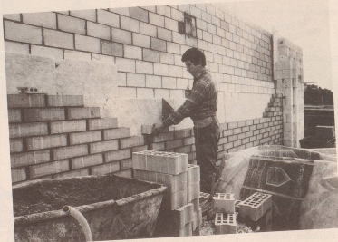
3 Jetzt kommt die Hüsli-Partei («Jedem Schweizer sein Einfamilienhaus»).