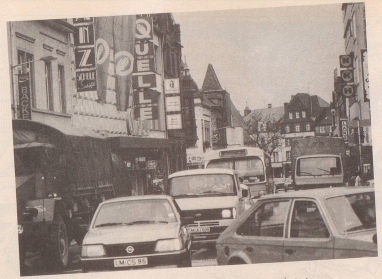
2 ... ist die Autopartei an den Wahlstart gesprintet.