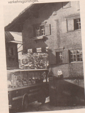
8 Frisch, frank, fröhlich, frei mit Auto- und Hüslipartei!