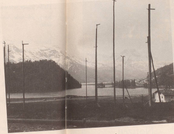
4 Bauland haben wir ja mehr als genug!