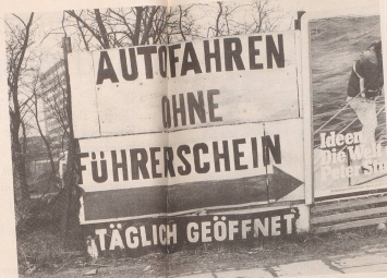
1 Mit vorbildlichem Elan («Freie Fahrt für freie Bürger») ...