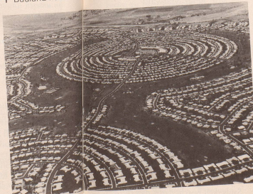
7 ... einer wohnlichen Gemeinde unserer herrlichen Schweiz.