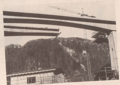
5 Das Ziel der neuen Parteien: Jedem Eidgenossen sein verkehrsgünstiges, ...