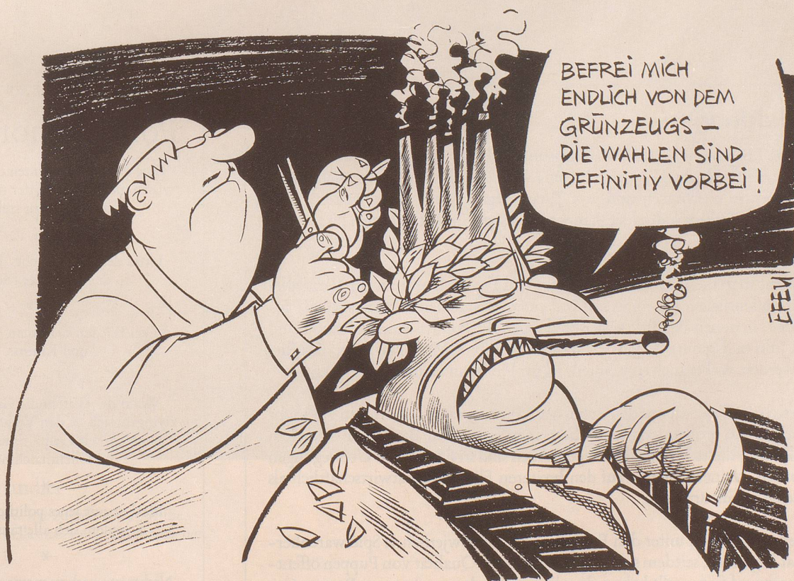
Montag, 19. Oktober 1987, der erste Tag nach der Wahl.