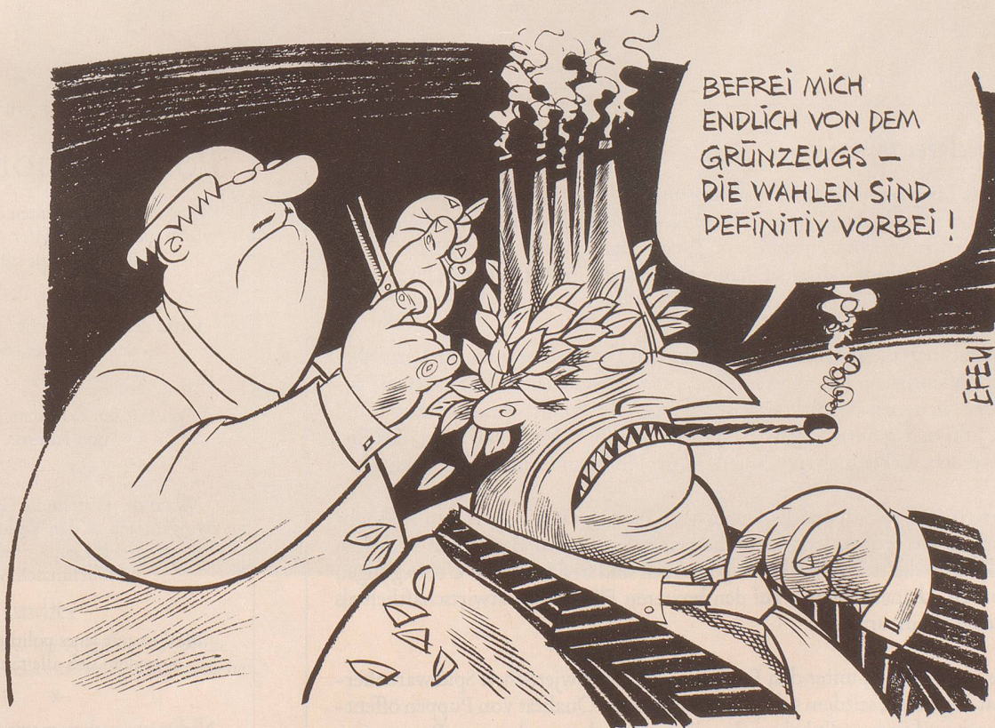
Montag, 19. Oktober 1987, der erste Tag nach der Wahl.