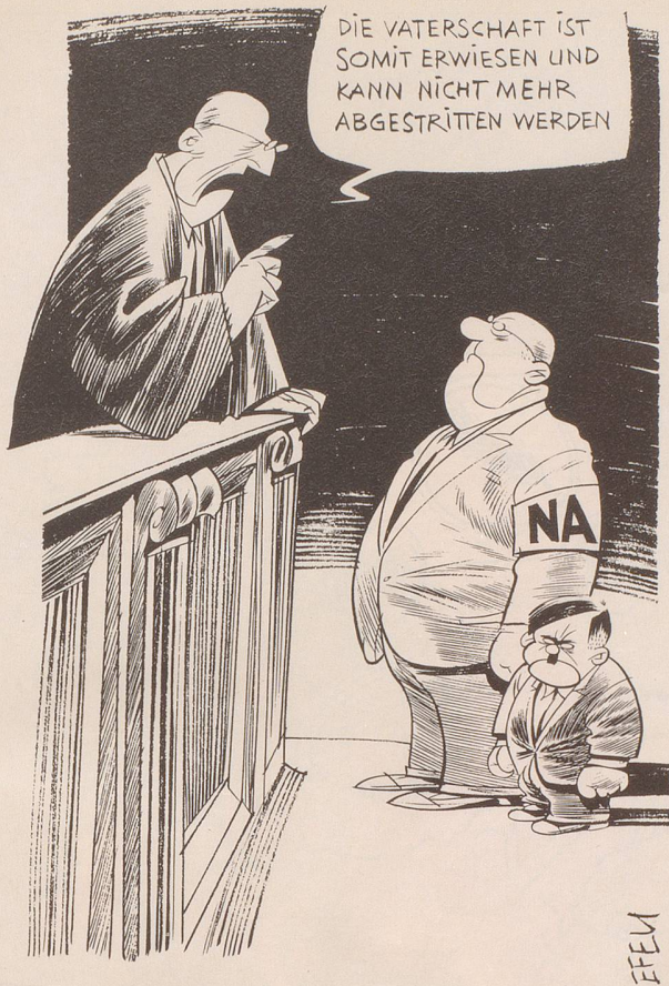
Das Bundesgericht hat festgehalten: Die Nationale Aktion (NA) darf als «nazihft rassistisch» bezeichnet werden.