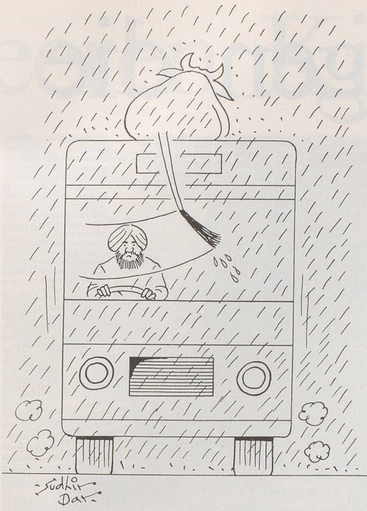
Sudhir Dar (Indien)