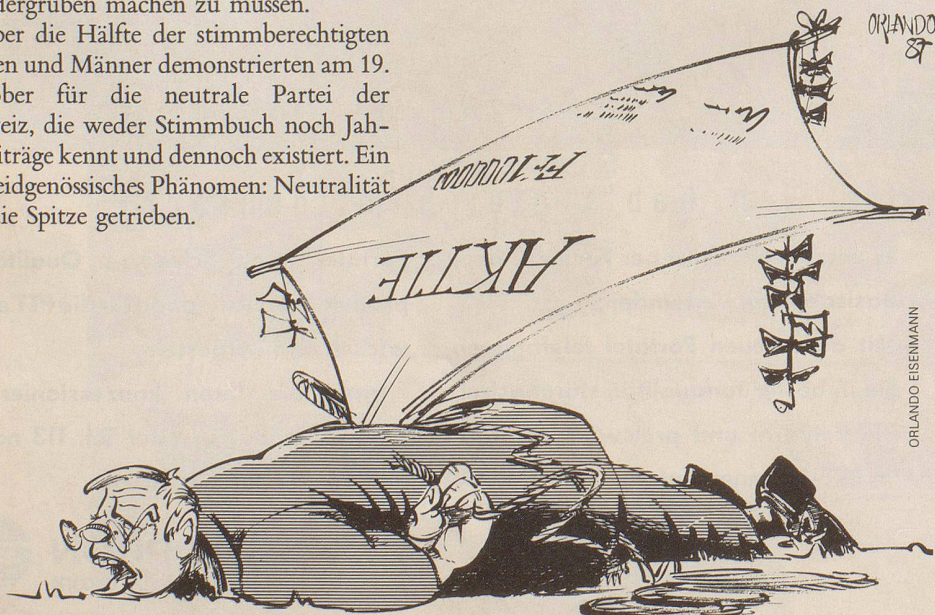
Tiefflieger am Aktienmarkt