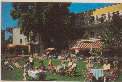
Kurhotel Habsburg, Gartenrestaurant