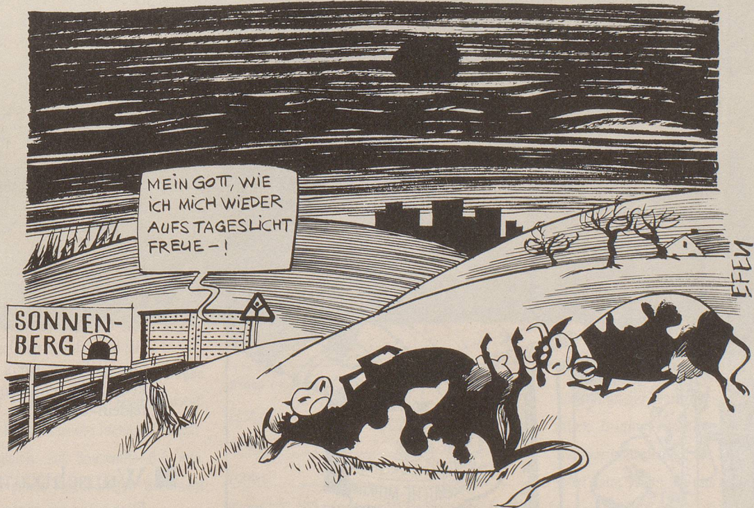
Der Ernstfall lässt sich nicht proben ...