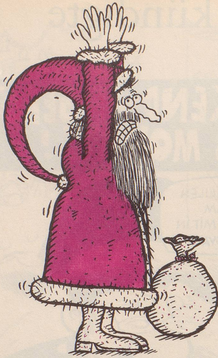
Der Bedrohte oder der Neurotische