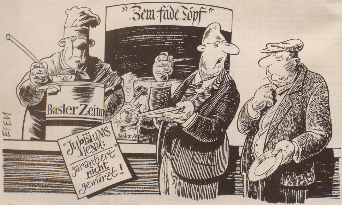
«Wenn ich nicht darauf angewiesen wäre, wäre ich schon längst in den Hungerstreik getreten!»

Während der Mustermesse 87 soll den Baslern Trost widerfahren. Ringier plant, während der Messe täglich eine Zeitung für Basel herzustellen. Dafür wird an der Muba eine komplette Zeitungsdruckerei aufgebaut und eigens eine Redaktion eingesetzt.