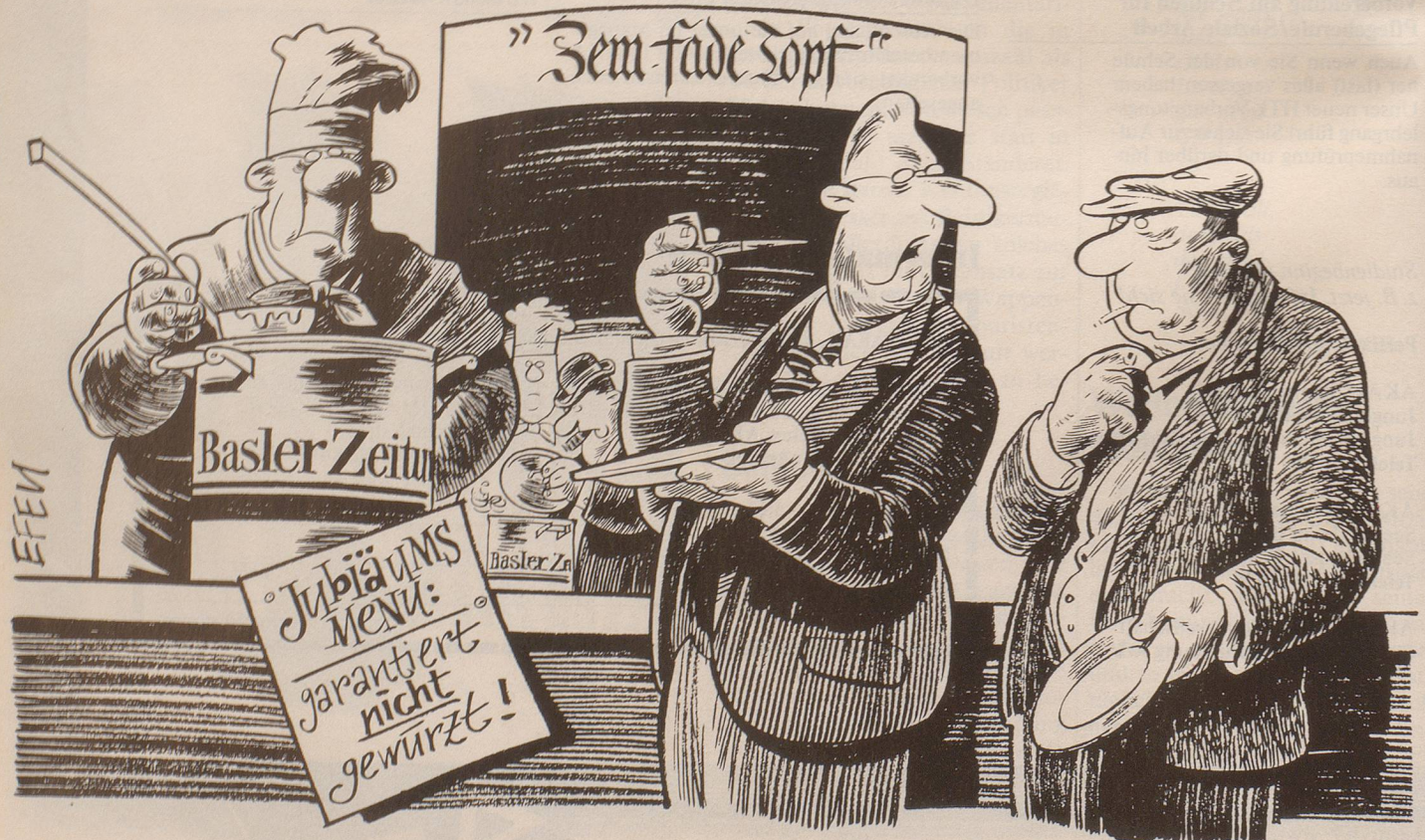
«Wenn ich nicht darauf angewiesen wäre, wäre ich schon längst in den Hungerstreik getreten!»

Während der Mustermesse 87 soll den Baslern Trost widerfahren. Ringier plant, während der Messe täglich eine Zeitung für Basel herzustellen. Dafür wird an der Muba eine komplette Zeitungsdruckerei aufgebaut und eigens eine Redaktion eingesetzt.