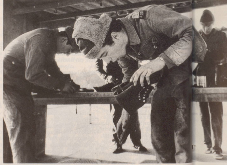
5 ... Umgang mit den Vorgesetzten ...