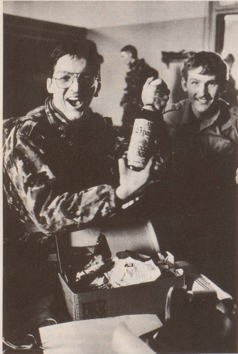
4 Denn RS bedeutet anderes: Umgang mit der Waffe, ...