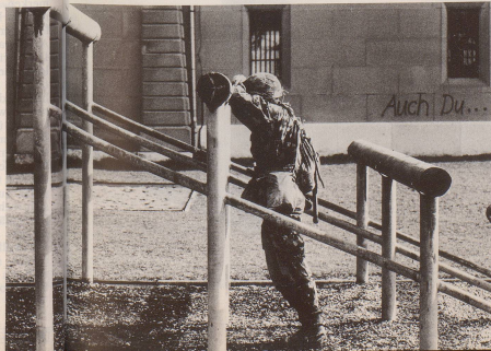
6 ... und Umgang mit deren Einfallsreichtum.