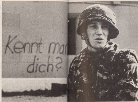
2 ... kritische Fragen verfällt, sollte Besuch einer RS absehen, ...