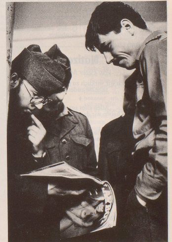
7 Und überhaupt: Irgendwann muss jeder zum Manne werden.