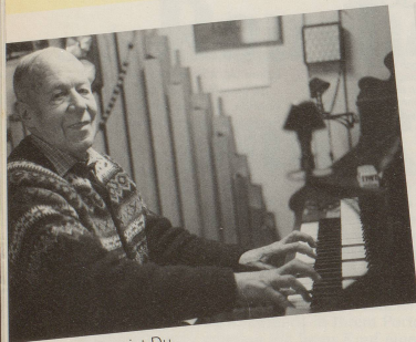
Gegrüsst seist Du ...