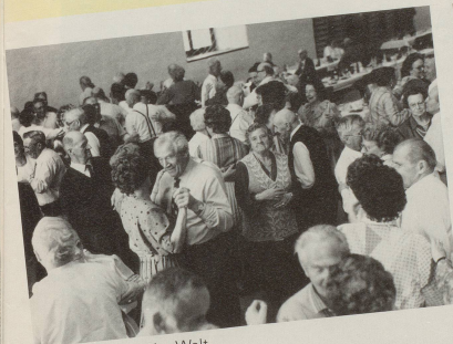
Willkommen in der Welt ...