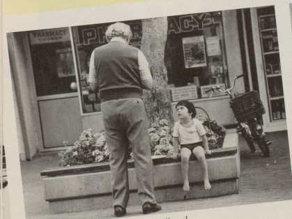
Und chrapfte bald, mein Butzibau!