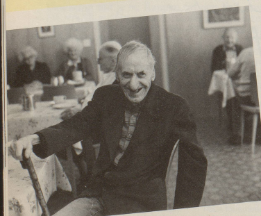
Ehr das Alter, la, lu, la!