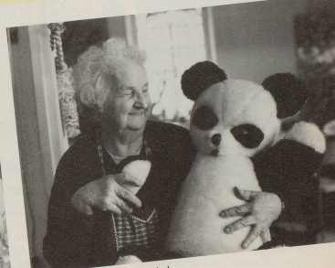
... der Rentner la, lu la!