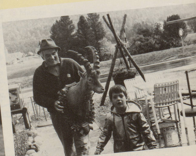
Schützt die Natur la, lu, la!