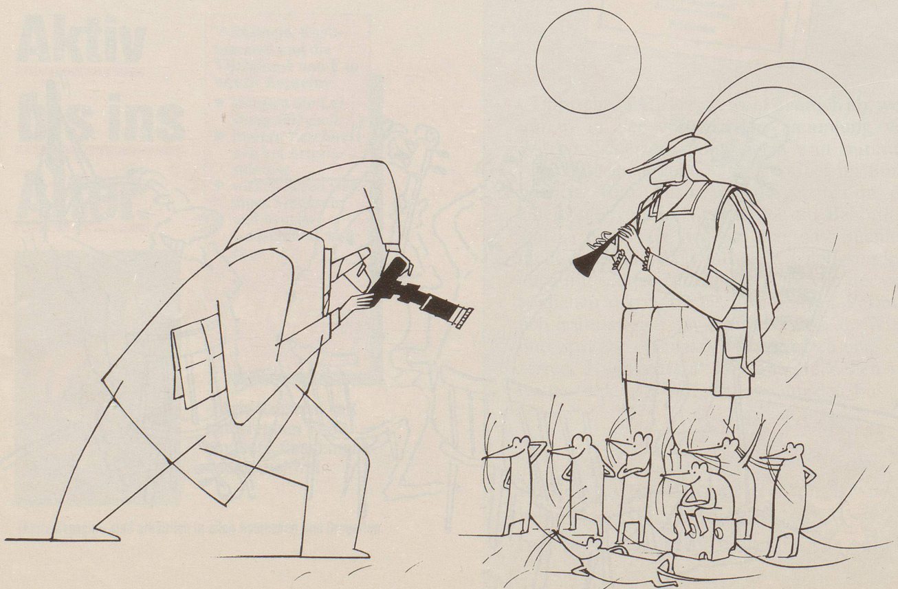
Erinnerungsfoto mit Rattenfänger