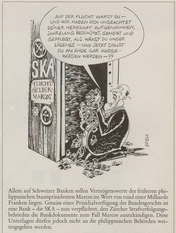
Allein auf Schweizer Banken sollen Vermögenswerte des früheren philippinischen Staatspräsidenten Marcos im Wert von rund einer Milliarde Franken liegen. Gemäss einer Präsidialverfügung des Bundesgerichts ist eine Bank – die SKA – nun verpflichtet, den Zürcher Strafverfolgungsbehörden die Bankdokumente zum Fall Marcos auszuhändigen. Diese Unterlagen dürfen jedoch nicht an die philippinischen Behörden weitergegeben werden.