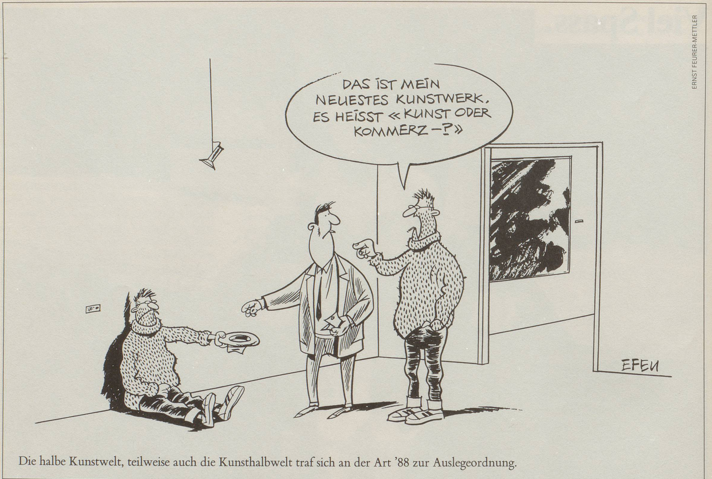
Die halbe Kunstwelt, teilweise auch die Kunsthalbwelt traf sich an der Art '88 zur Auslegeordnung.