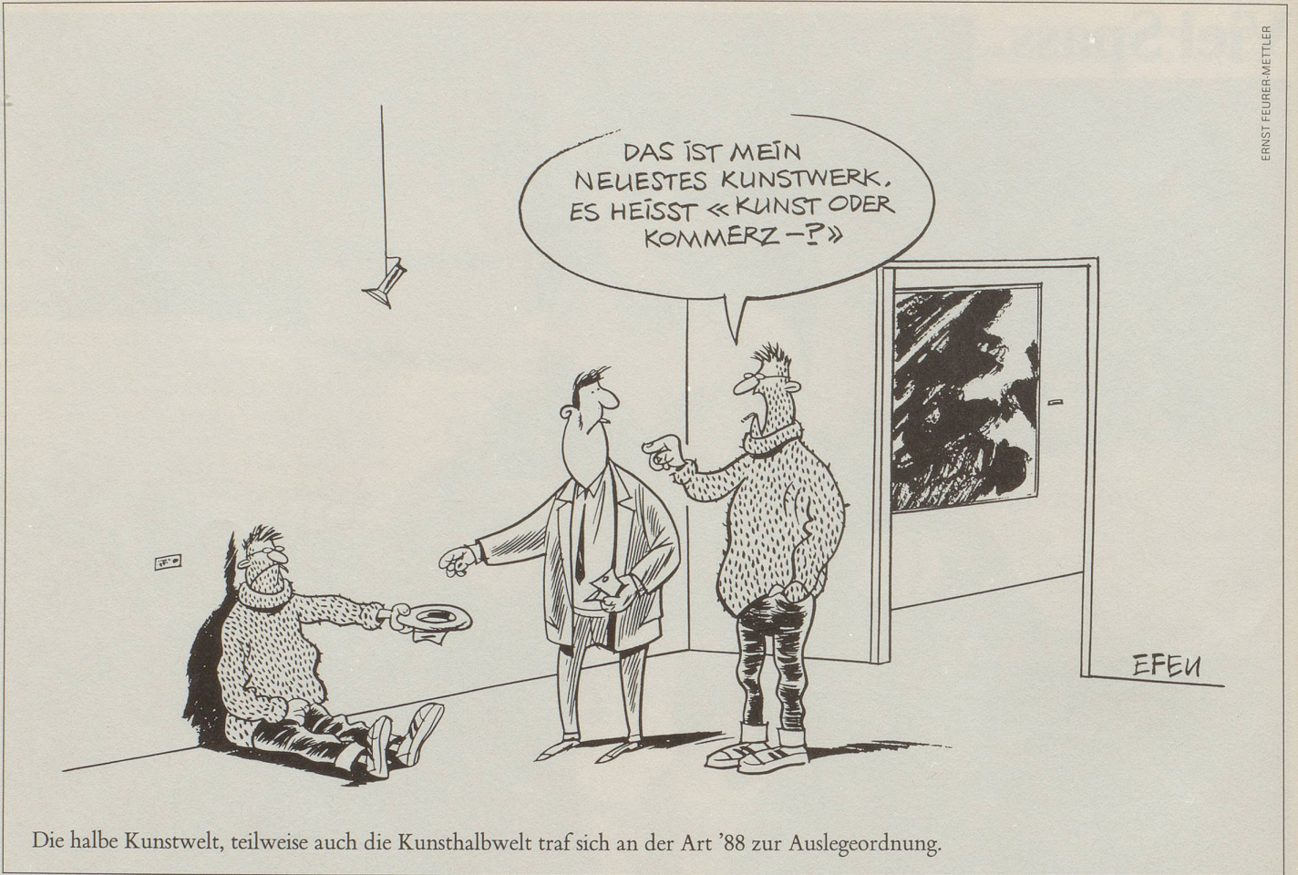
Die halbe Kunstwelt, teilweise auch die Kunsthalbwelt traf sich an der Art '88 zur Auslegeordnung.