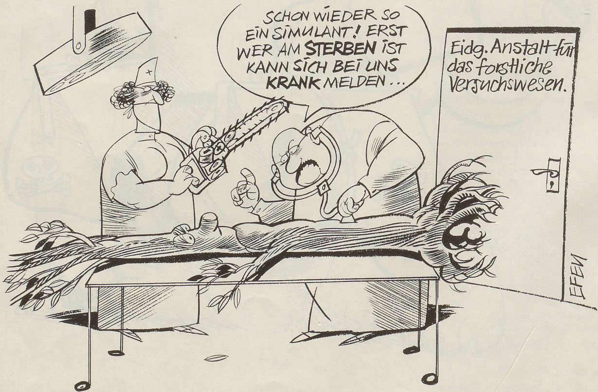
Rodolphe Schläpfer (Direktor der Eidg. Anstalt für das forstliche Versuchswesen) hat sich mit seinem Vorschlag, den Begriff «Waldsterben» durch den scheinbar weniger gravierenden Ausdruck «Vitalitätsverlust» zu ersetzen, dem Vorwurf der Verharmlosung ausgesetzt.