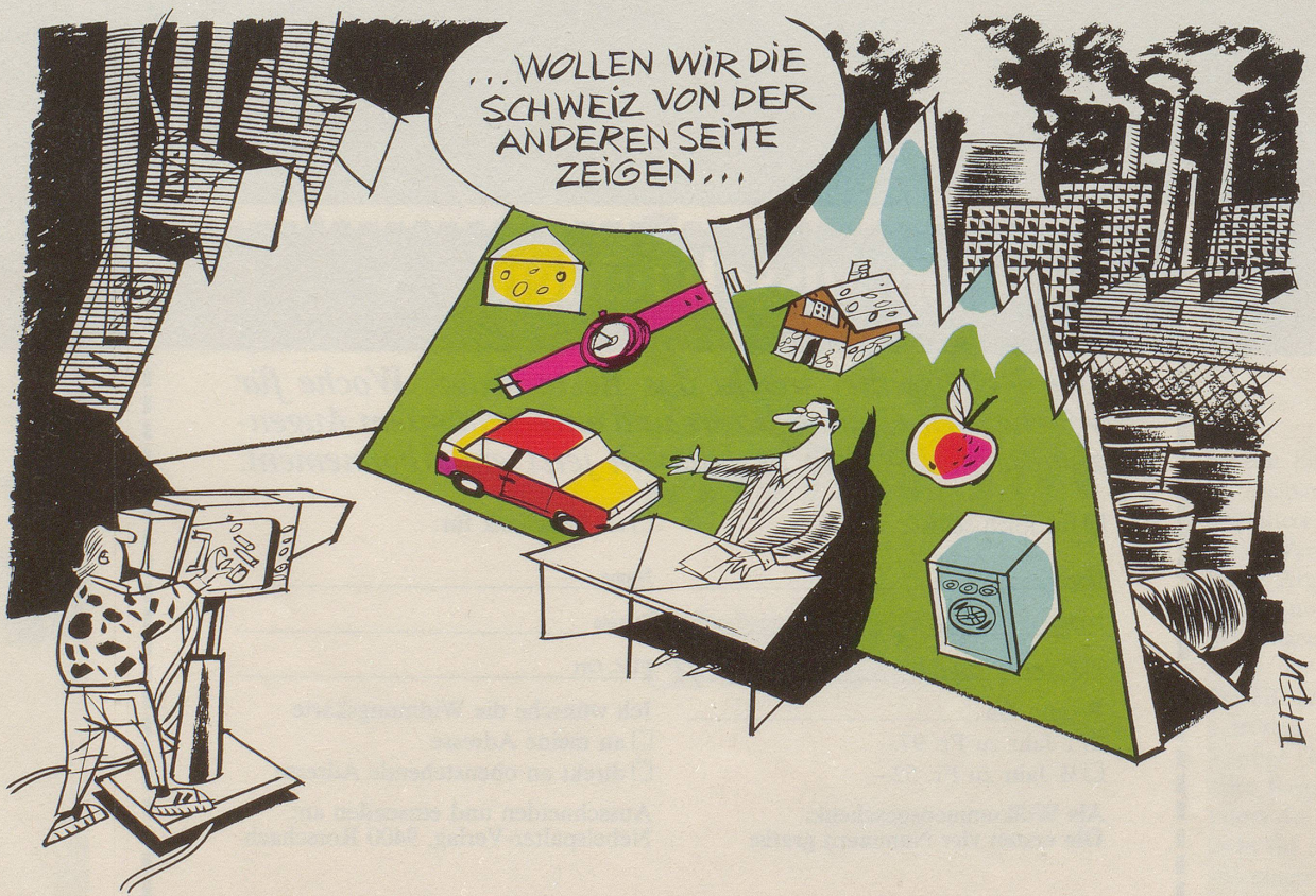
1991 will ein privates «Wirtschaftsfernsehen» in der Schweiz auf Sendung gehen.