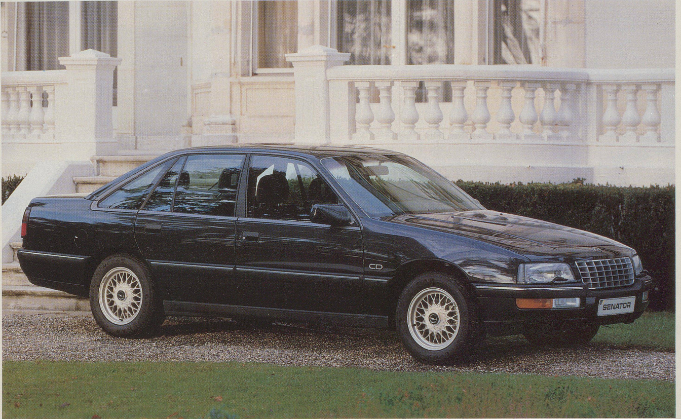
Senator CD: 3.0i-Sechszylinder, 130 kW (177 PS), elektronisch gesteuerter 4-Stufen-Automat, Servotronic-Lenkung, DSA-Fahrwerk mit Ride Control, ABS, Klima-Automatik.