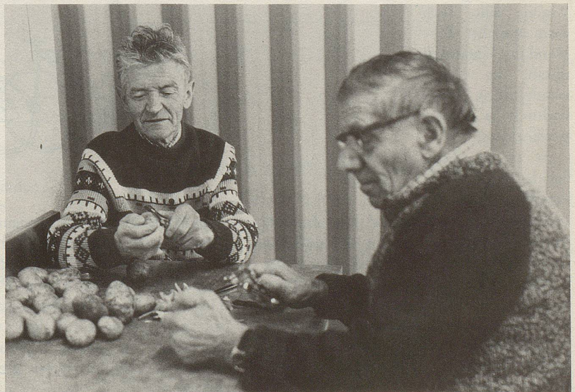
8 ... durch bedingungslose Solidarität.