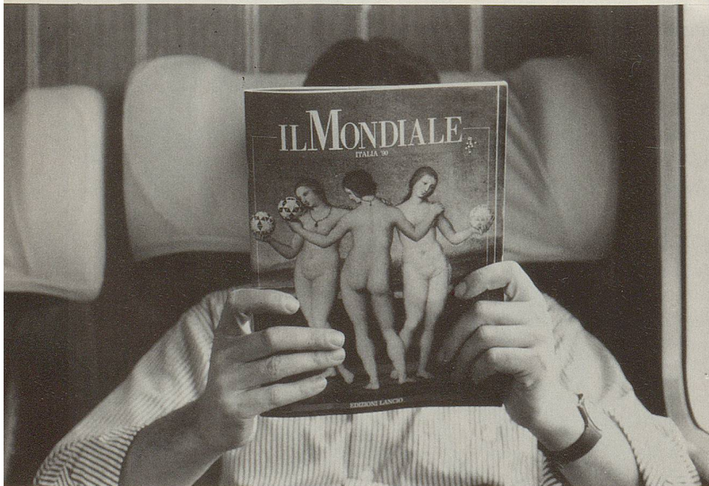
5 Die verständliche Flucht in überholte Macho-Träumereien birgt leider die Gefahr ...