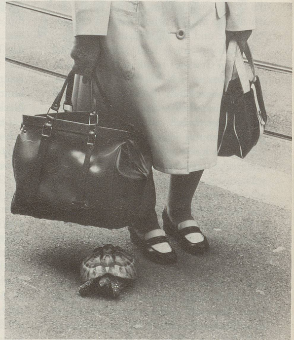
2 ist durch die rasche Emanzipation der Frau ...