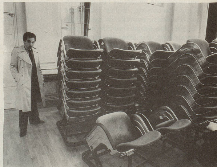
6 ... dass sich der moderne Mann schlussendlich zwischen alle Stühle setzt.