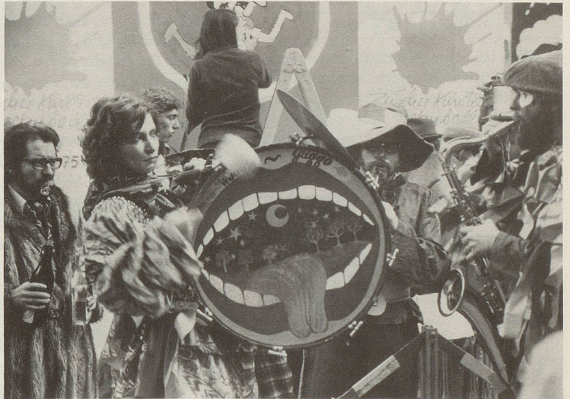
4 Längst ist nicht mehr klar, wer in unserer Gesellschaft den Marsch bläst und wer auf die Pauke haut.