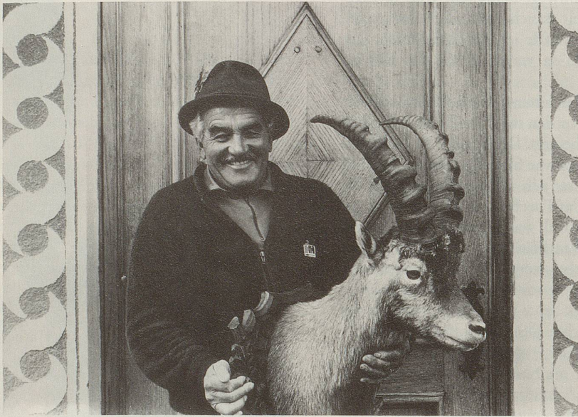
1 Das männliche Selbstwertgefühl ...