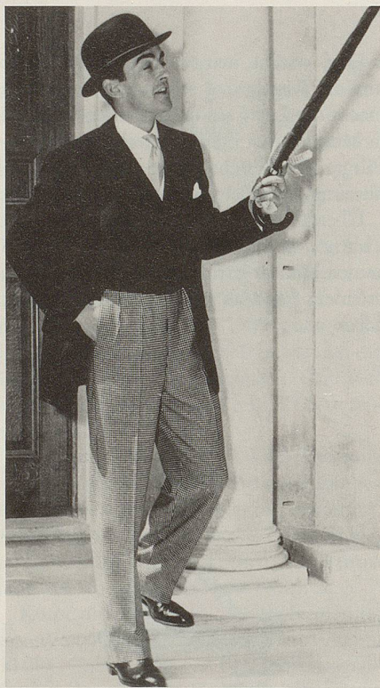
Englischer City-Gentleman mit Bowler

Ersparen wir es uns, auch noch Reklame für ihn zu machen, es geht ihm immer noch leidlich gut, auch heute, da er nur noch 350 Mitarbeiter beschäftigt. Direkt nach Kriegsende waren es zehnmal so viele. Der Bowler, scheint's, hat das zähe Nachleben eines Schlossgeistes, und so nimmt es kaum wunder, wenn selbst Einkaufspaläste wie Harrods und Selfridges den Bowler im Sortiment führen, wiewohl er doch vom Stadtbild verschwunden ist. Makler tragen ihn nicht mehr, und Bankangestellte haben ihn sich längst abgewöhnt; die quicken Geldfische und Bauspekulanten ziehen als Markenzeichen das tragbare Telefon vor. Auf dem Lande, ja, da sieht man sie noch einzelt – die Bowlerträger, bei Pferdemeetings und anlässlich eines Dorffestes, und