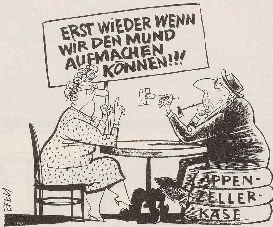
Als Reaktion auf die Ablehnung des Frauenstimmrechts in Appenzell Innerrhoden wollen viele Frauen keinen Appenzeller Käse mehr kaufen. Diese Käsesorte wird auch in Ausserrhoden und im Kanton Thurgau produziert – was man dem Käse nicht ansieht ...