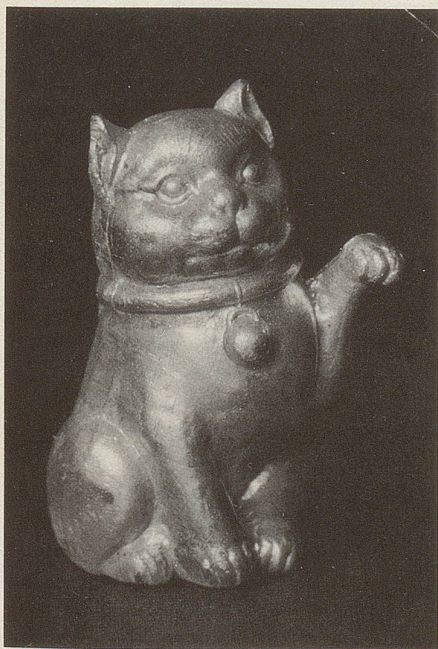
Das ist die «Welcome-Cat», der einladende, «kundenfischende» Talisman japanischer Geschäftsleute.

ihn schon während des Zweiten Weltkriegs begleitet hatte, und Lyndon B. Johnson berührte vor einer Flugreise immer ein von einem alten Indianer geschnitztes Holzflugzeug auf seinem Schreibtisch im Weissen Haus. Weitere Prominentenmaskottchen sind Heinz Rühmanns silberne Maus, Charlie Chaplins Schuhbändel aus «Goldrausch», Greta Garbos in Gold gefasster Kieselstein, Caterina Valentis Glücks-Sandaletten und Sophia Lorens Halskette aus Korallensplittern.