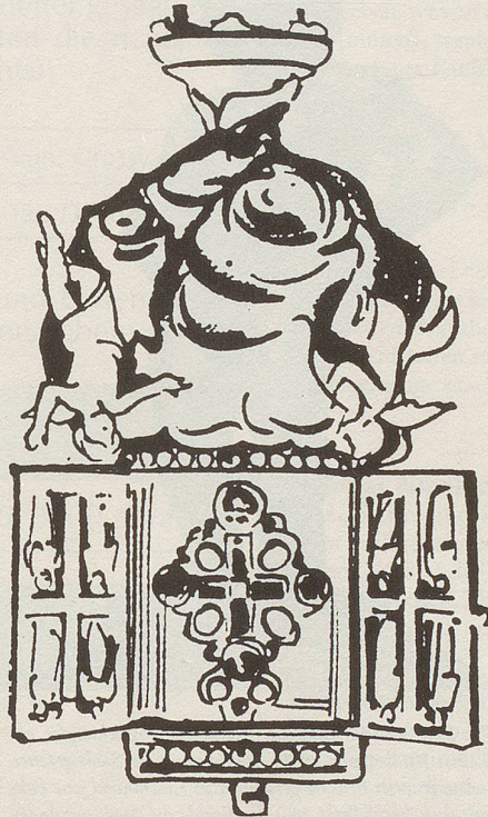
Der (ost)römische Kaiser Konstantin (der Konstantinopel-Gründer) trug diesen Talisman mit angeblich echten Fragmenten des Kreuzes Christi sein ganzes Leben lang auf sich, obwohl er sich erst in seinen letzten Stunden zum Christentum bekehrte.

F. D. Roosevelt trug stets ein in Platin gefasste Stück Glücksholz als Uhranhänger bei sich, sein Präsidentenkollege Dwight D. Eisenhower glaubte an die Wunderwirkung eines alten Fünfdollar-Goldstücks, das