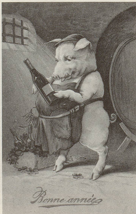
Auch das Glücksschwein – hier in der Variante eines Kellermeisters – gehört zum beliebten Arsenal der populären Talismane.