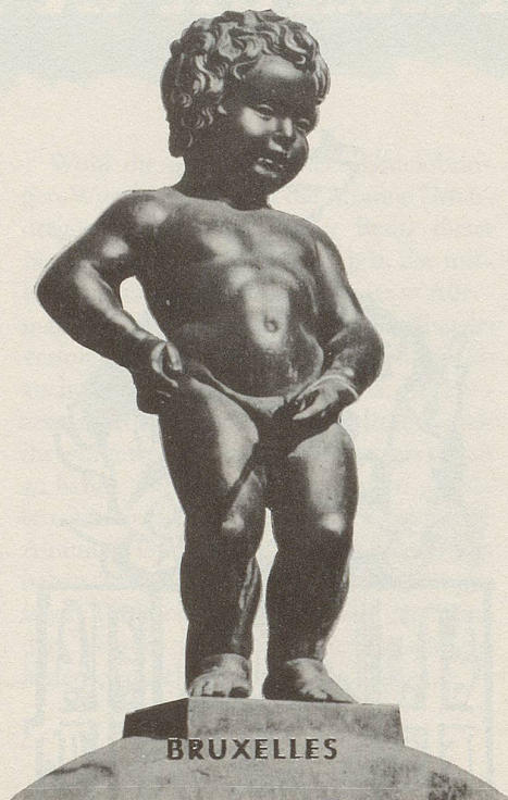
Die Legende vom Bruxeller Manneken Pis behauptet, ein kleiner Knabe habe im 13. Jahrhundert die Stadt gerettet, indem er unter Einsatz persönlichster Löschmittel jene Fackel «entschäftigt» habe, mit der Feinde die Stadt anzünden wollten. So ist der sein Geschäftchen verrichtende Jüngling zum Talisman der belgischen Capitale geworden.