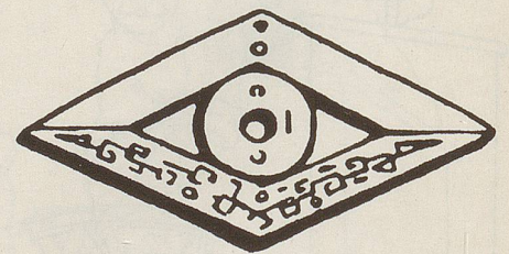
Dieses chinesische Rebus-Amulett mit zwei Ch'Ing-Musiksteinen und der runden Glücksscheibe in der Mitte verheisst dem Träger oder der Trägerin mit der Inschrift nicht nur simplen, sondern doppelten zukünftigen Wohlstand.