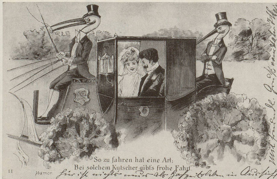
Die immer seltener werdenden Störche gelten als Symbole der ehelichen Fruchtbarkeit. «So zu fahren hat eine Art – bei solchem Kutscher gib'ts frohe Fahrt!»