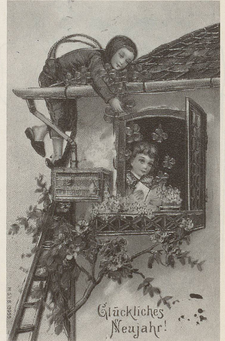
Der Schornsteinfeger lässt vierblättrigen Glücksklee regnen! Während früher der «Kreuzformklee» (man trug ihn in einem Beutel aus Maulwurfshaut, zusammen mit Hummelwachs) noch sehr selten war, kultiviert man ihn heute als «mexikanischen» vierblättrigen Sauerklee auch in europäischen Plantagen in einer Art Talisman-Agrarindustrie.

A UCH GANZ GEWÖHNLICHE Steine nährten den Talisman-Aberglauben: So trugen englische Arbeiter noch im letzten Jahrhundert sogenannte «Krampfnüsse» als Amulett gegen Krämpfe bei der Arbeit in der Hosentasche. Solche Krampfnüsse könnten vielleicht auch gute