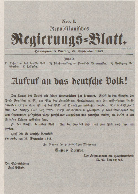
So sah das Titelblatt der allerersten (gesamt)deutschen Zeitung aus. Unten rechts signierte M. W. Löwenfels als Deutschlands General Nr. 1.