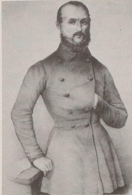
Gustav (von) Struve, der «mutmassliche» erste deutsche Staatspräsident für vier Tage. Er sorgte dafür, «dass die Dinge in Fluss kamen». Dafür hängt er jetzt im Lörracher Heimatmuseum ...