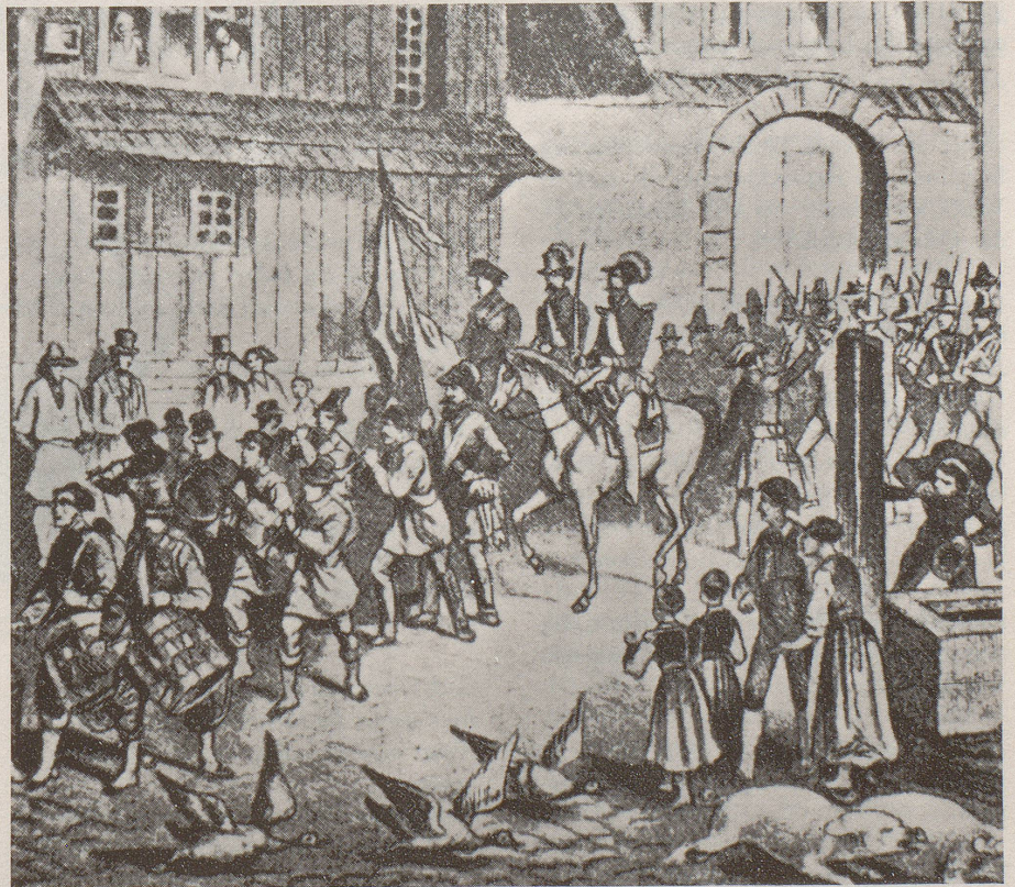
Mit Trommlern und Pfeifern (kein Wunder, man kam ja von Basel ...) zogen die Badischen Freischärler zur ersten Deutschland-Gründung in Lörrach ein.