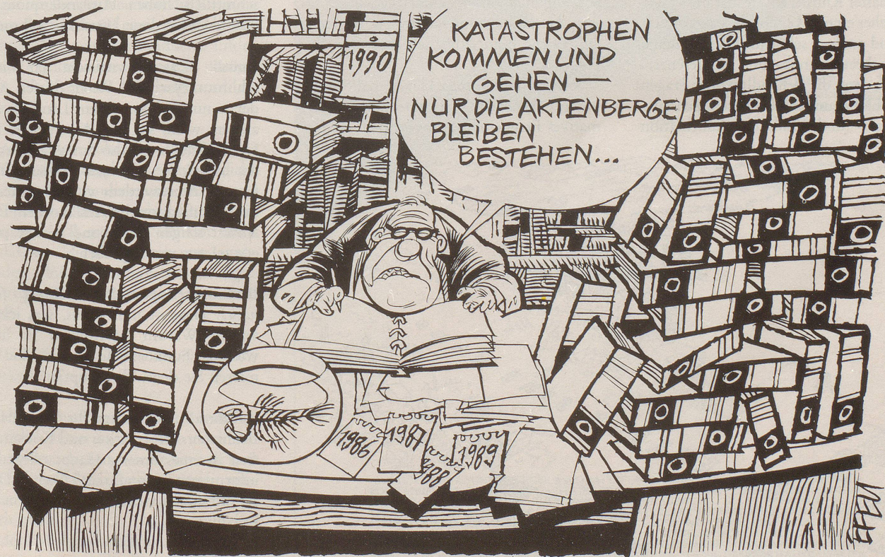
Der Fall Schweizerhalle verjährt im Mai 1994, und noch immer ist kein Urteil gesprochen.