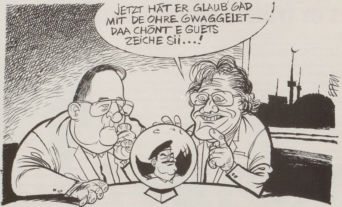
Operation «Kalif von Bagdad» – Drama mit halb gutem Ende