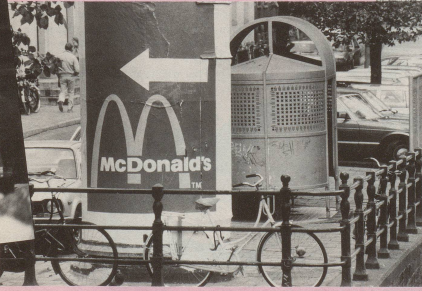
7 Schweizer Eigenart ist Trumpf! Selbst die neuen Gastronomieketten verwenden für ihren Frass ...