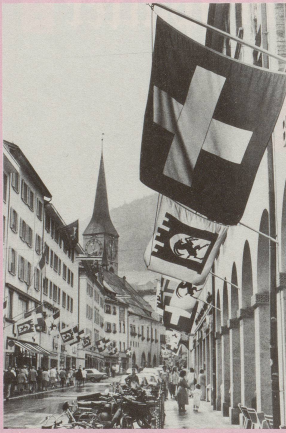
1 In den pittoresken Gassen der Schweizer Altstädte ...