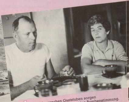
6 Und in manchen Gaststuben sorgen die Witze des Wirtes für eine Bombenstimmung.