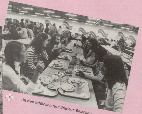
4 ...in den zahllosen gemütlichen Beizchen.