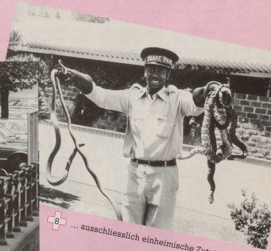
8 ...ausschliesslich einheimische Zutaten.