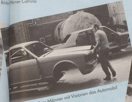
Da geschah es, dass Männer mit Visionen das Automobil erfanden.