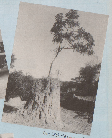
Das Dickicht wich zurück.