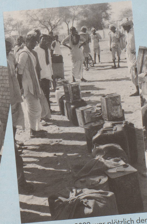
... doch im Jahr 2033 war plötzlich der letzte Tropfen Öl verbrannt.