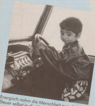
Energisch nahm die Menschheit nun das Steuer selbst in die Hand.