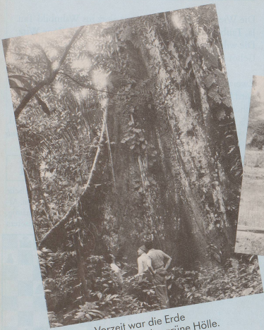
In grauer Vorzeit war die Erde eine menschenfeindliche grüne Hölle.