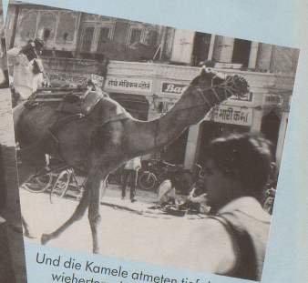
Und die Kamele atmeten tief durch und wieherten, dass die Höcker zitterten.