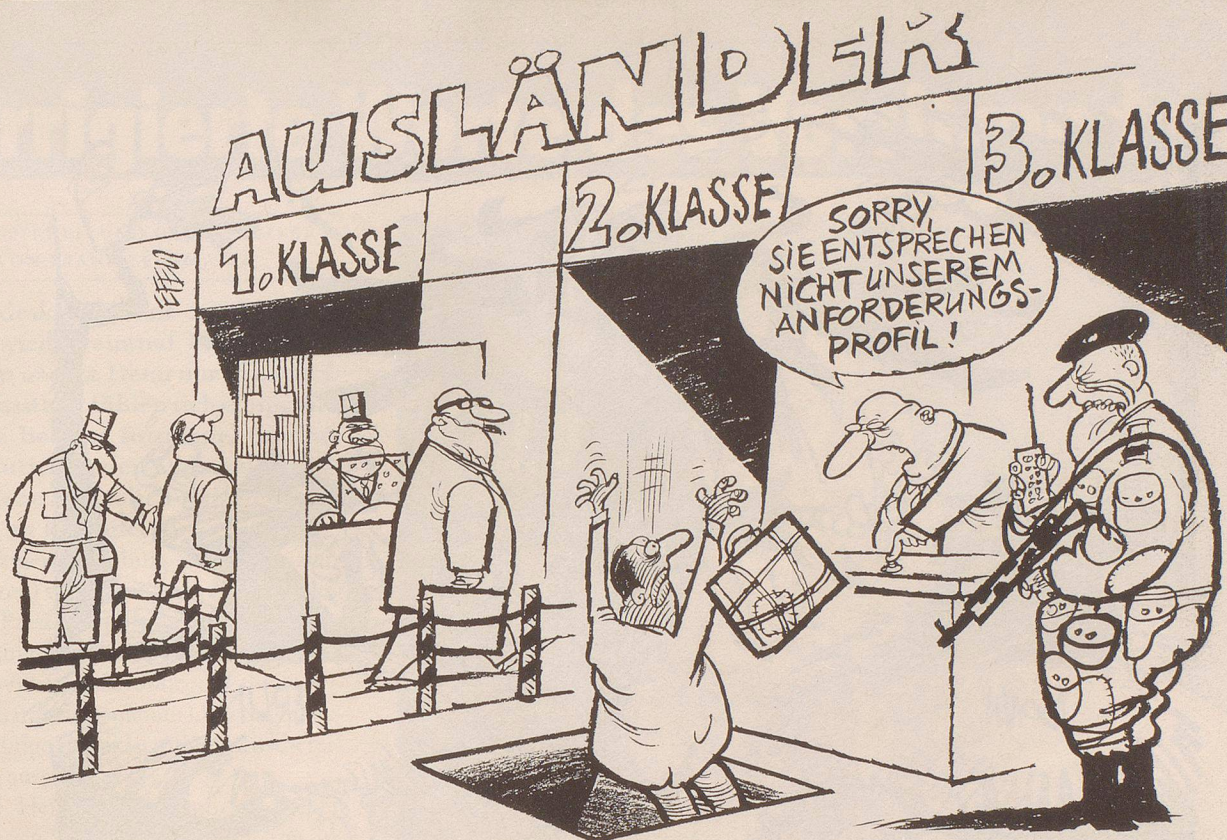
In seinem jüngsten Bericht zur Ausländer- und Flüchtlingspolitik schlägt der Bundesrat bezüglich Bewegungs- und Niederlassungsfreiheit von Ausländern in der Schweiz ein sogenanntes «Drei-Kreise-Modell» vor.