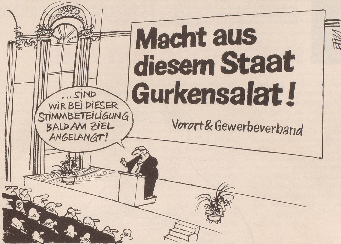
Niedrige Stimmbeteiligungen begünstigen die Wirkung von Einflussnahmen aktiver Verbände und anderer Interessensgruppen auf den Ausgang von Abstimmungen über entsprechende Vorlagen.