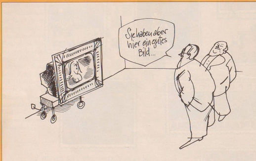
Text und Bild: Hans Sigg