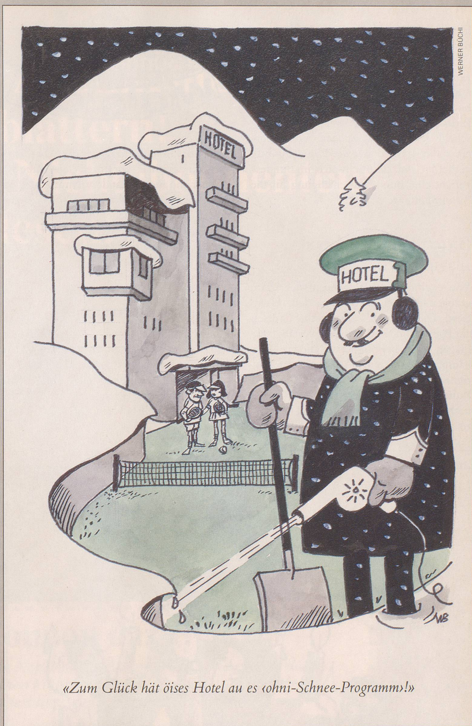
«Zum Glück hat öises Hotel au es «ohni-Schnee-Programm!»»

Und natürlich ist auch der Durch-schnittsbürger selbst betroffen. Durch seine geänderten Gewohnheiten wird allerdings ein sogenanntes Feedback erzeugt, das schlussendlich sogar Rückwirkungen auf das Klima zeitigen dürfte. Der Studie nach sind nämlich die ganzen Klimaveränderun-