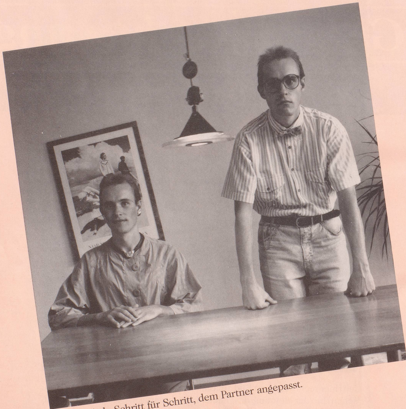
... allmählich, Schritt für Schritt, dem Partner angepasst.