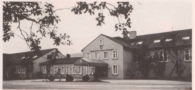
Im Medizinischen Centrum Mariastein finden Patienten Genesung und erholsame Ruhe.

Das Medizinische Centrum Mariastein ist eine Spezialklinik zur Abklärung und Behandlung von: