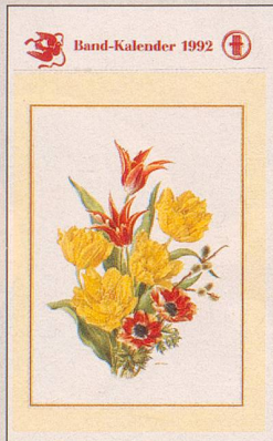
Band-Kalender 1992 mit Blumenbildern von A.M. Trechslin Fr. 14.-

Die Kalender-Bilder sind perforiert und können als Postkarten verwendet werden.