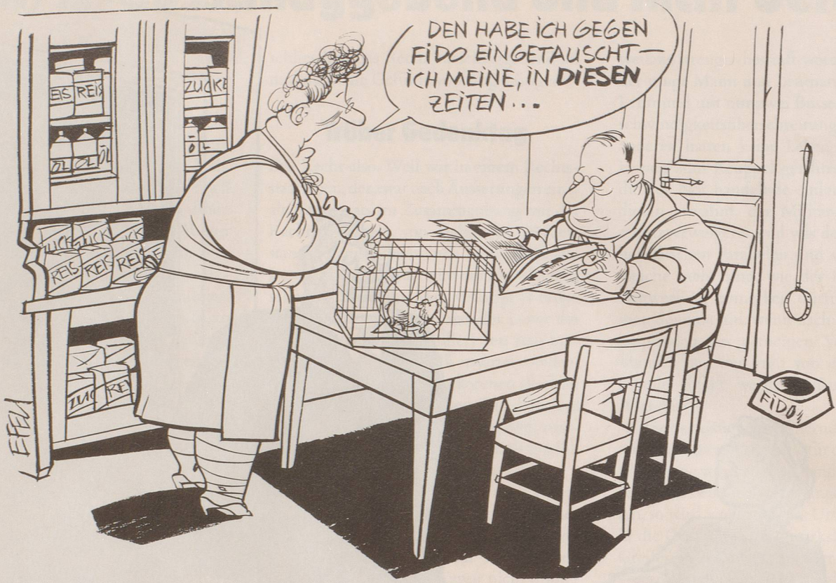
Die Aussicht auf den Golfkrieg hat der Schweiz eine Welle von Hamsterkäufen beschert.