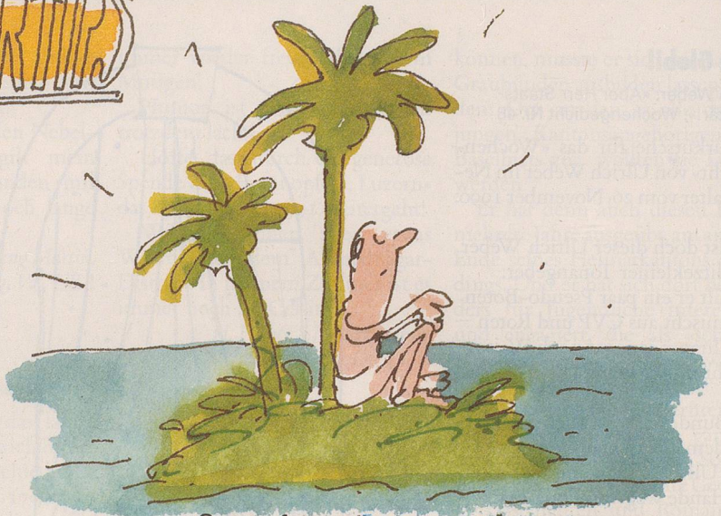
Steuerfussmässig noch etwas günstiger als Monaco

Der heutige Abend geht auf meine Spesenrechnung!